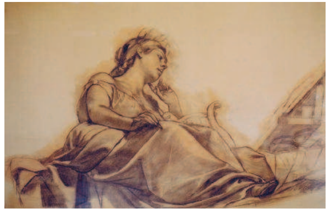
Tali, musa della commedia e della poesia, dopo il restauro.