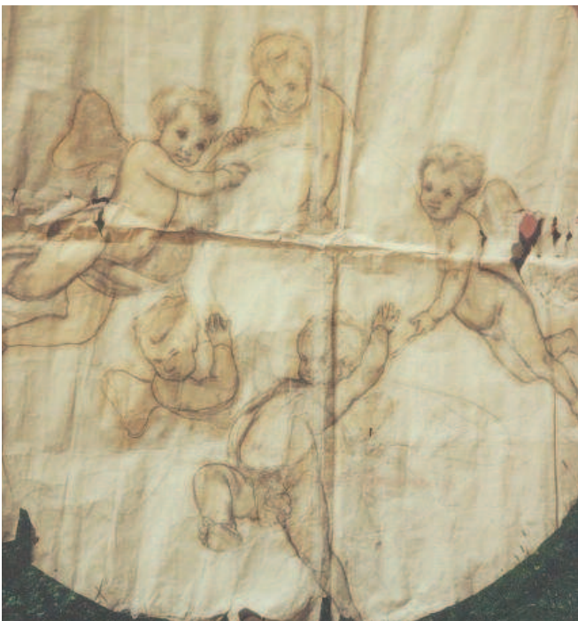
Tondo di Luigi Manini, prima del restauro.