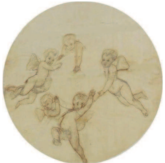
Dopo il restauro.