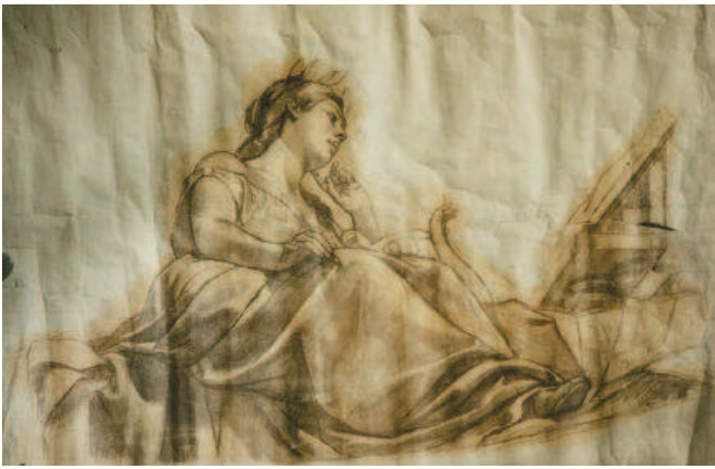
Tali, musa della commedia e della poesia, prima del restauro.