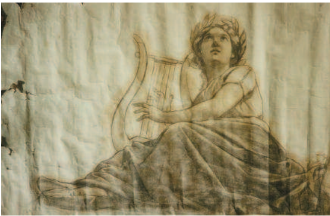
Tersicore, musa della danza e del canto, prima del restauro.