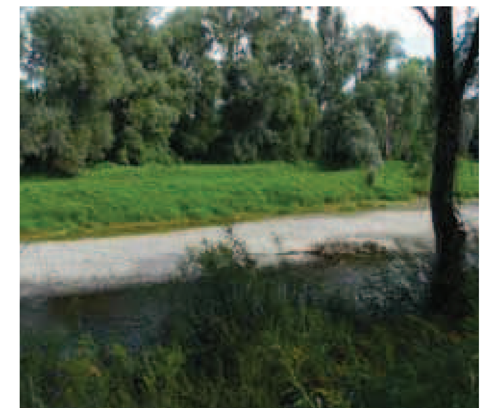
12. Humulus japonicus