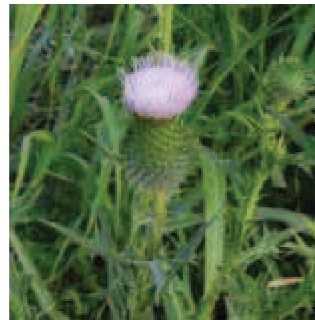
6. Cirsium vulgare