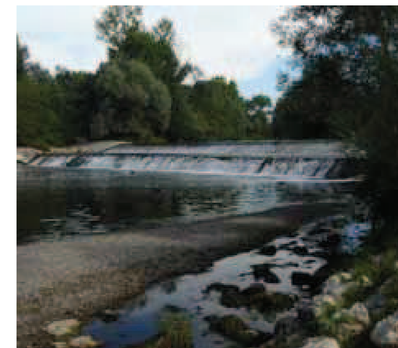
11. Palata Menasciutto

Poco oltre un impianto di alberature da legname pregiato può sembrare a prima vista un elemento di pregio naturalistico, ma l'impianto in geometrici filari e la pratica di continui interventi di "discatura" per eliminare le "erbacce" impedisce lo sviluppo di un sottobosco degno di questo nome, limitando la presenza vegetale a poche e banali specie pioniere, continuando a ricreare le condizioni che favoriscono appunto proprio la presenza di quelle erbacce che si vorrebbero eliminare. Le cose migliorano un po' in prossimità della palata, dove veniamo salutati da un ramarro che si scalda ai raggi del sole (fig. 10). Ed ecco infine le rapide create dalla palata (fig. 11) che già di per sé creano un paesaggio pieno di suggestioni. Le sponde del Serio sono ancora ombreggiate da salici e pioppi bianchi, ma il greto è completamente sommerso da una coltre di luppolo giapponese ( Humulus japoni-