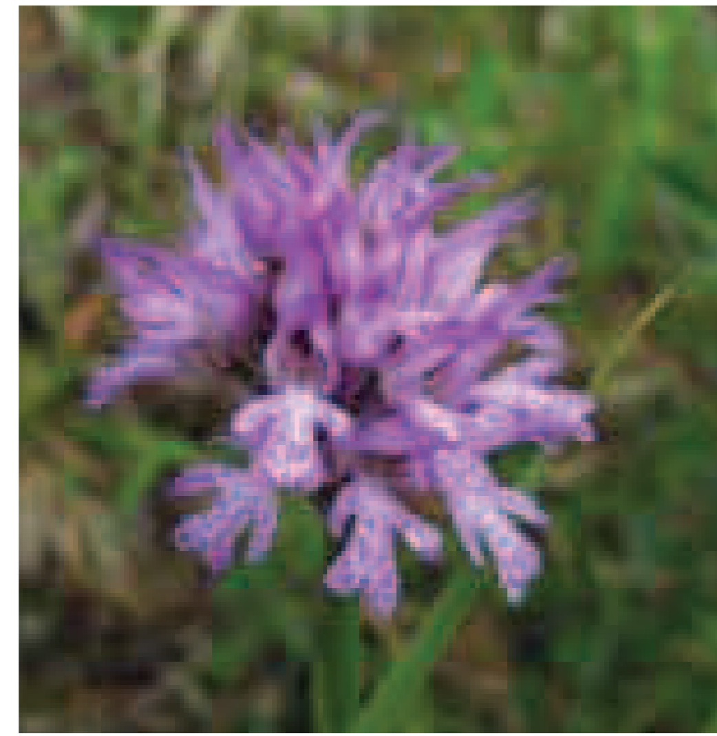
2. Orchis tridentata