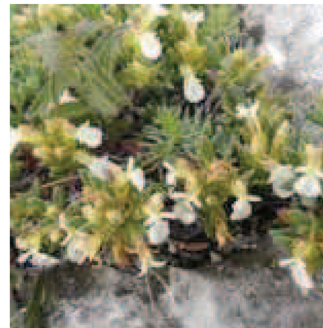
4. Teucrium montanum