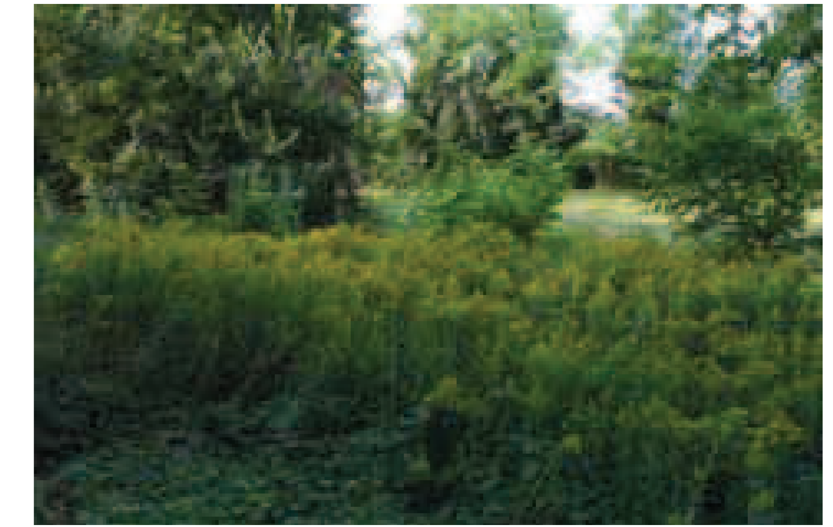
8. Solidago gigantea