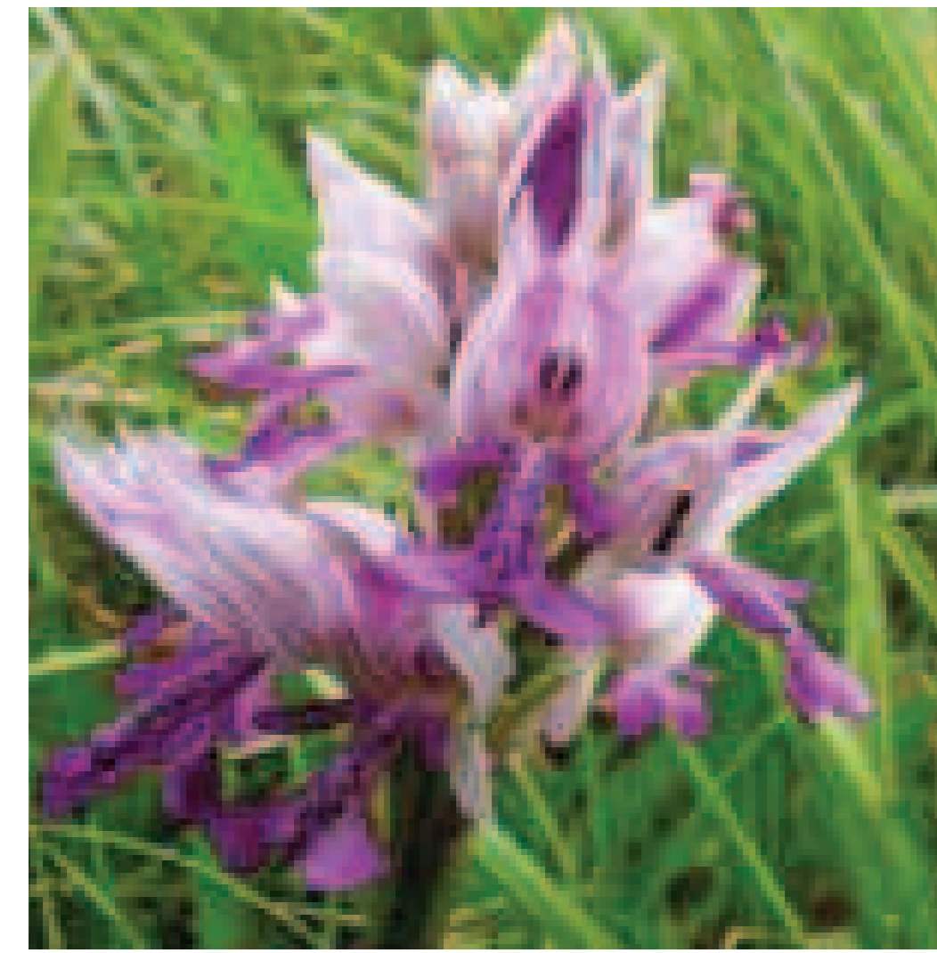
1. Orchis militaris