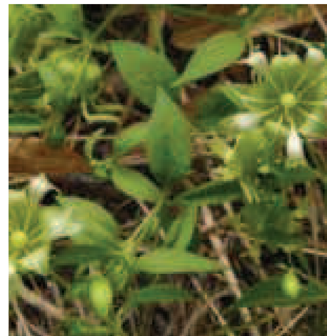
5. Cucubalus baccifer