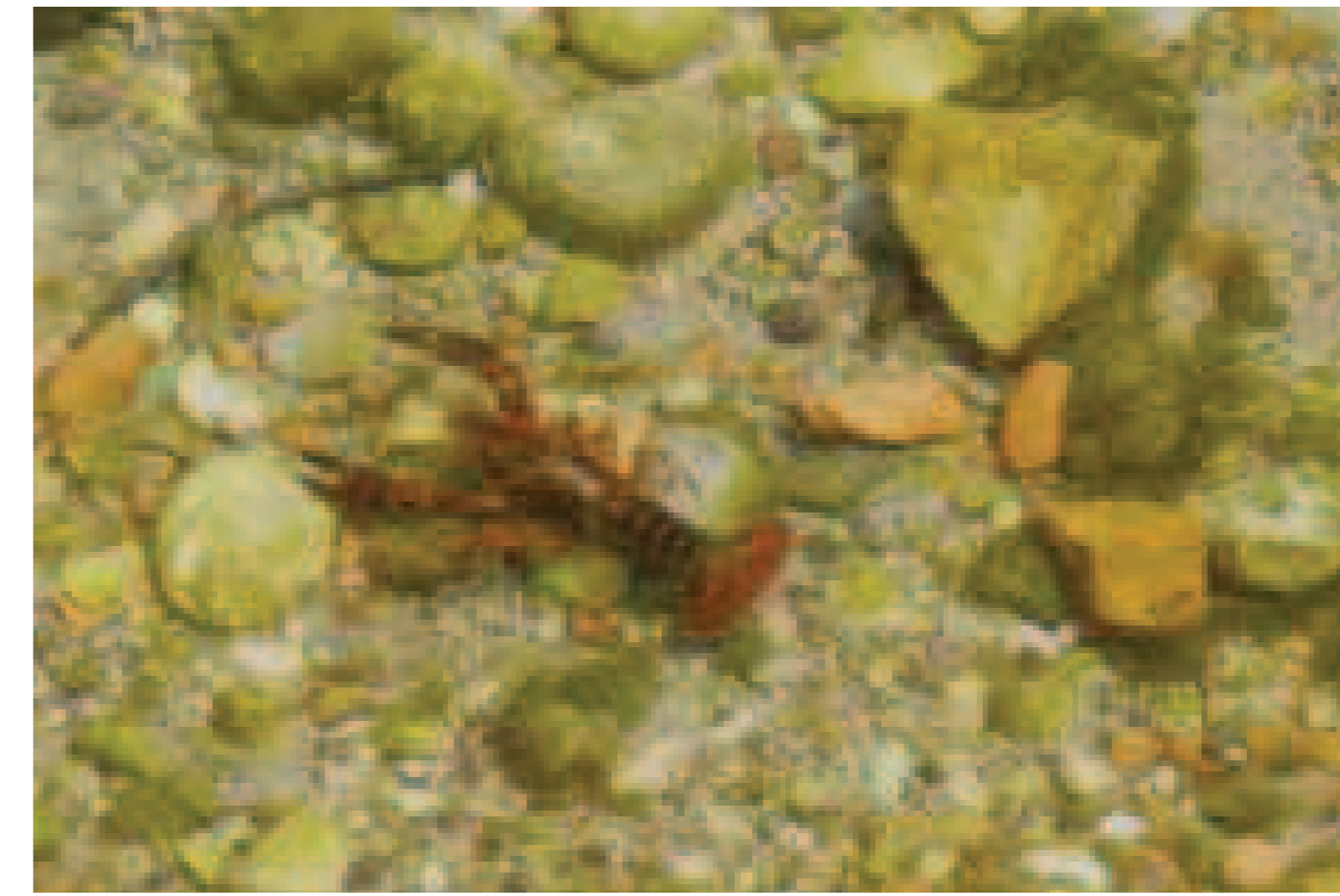
7. Procambarus clarckii