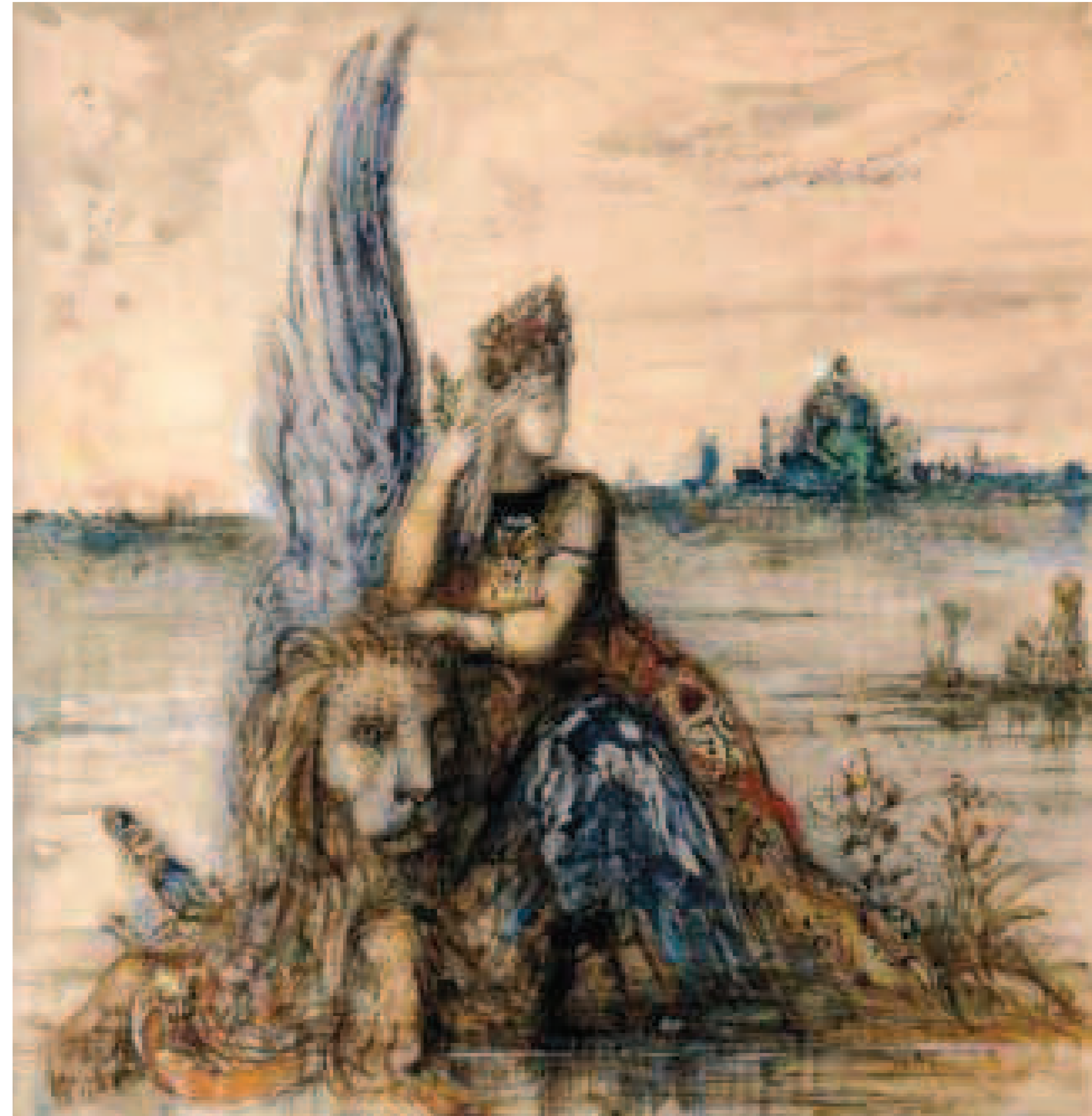
1. Gustave Moreau, Venise , 1858, Acquerello, Parigi, Musée Gustave Moreau